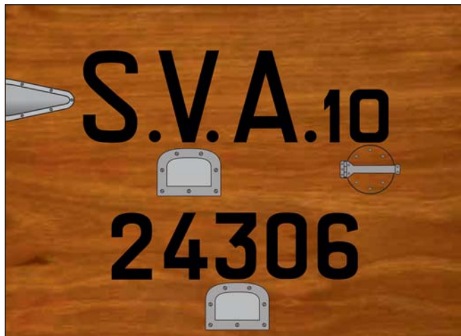
Sopra a sinistra: disegno illustrante gli impennaggi del velivolo in primo piano nella foto precedente. Sopra a destra: riproduzione dei dati matricolari del velivolo 24306, contraddistinto dal numero individuale I in carattere romano (vedi a sinistra foto pagina precedente in basso). Notare come lo stile delle lettere e numeri si discosti notevolmente dal velivolo immatricolato 24317.