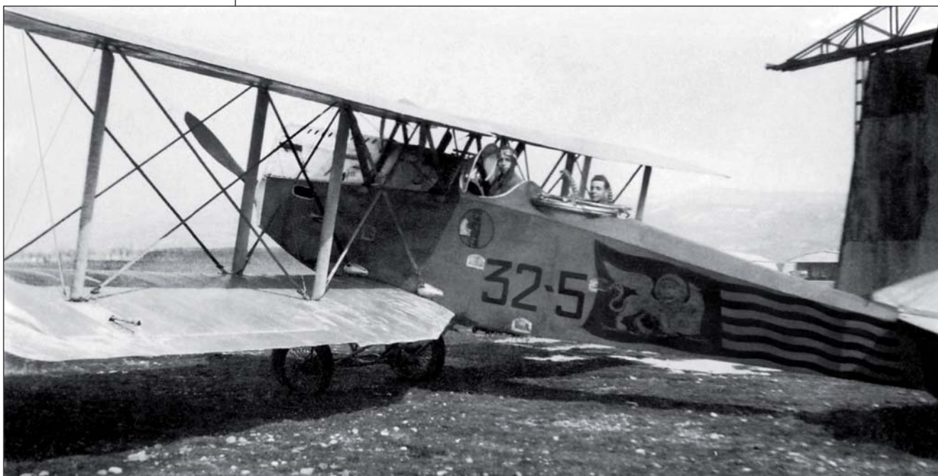
Un Ansaldo A300/4 ripreso a Boscomantico. Il terreno brullo e il fascio rivolto in avanti fanno supporre il periodo invernale 1927/28 o successivo. In fusoliera è presente lo stemma della Serenissima, adottato quale distintivo del 15° Gruppo da R.T., in ottemperanza al disposto del Foglio d'Ordini n. 10 del 5/4/1927.